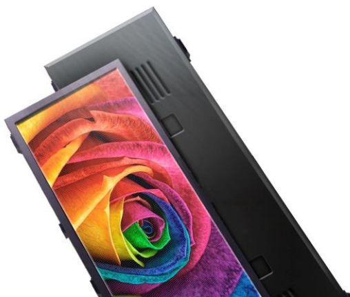
Rótulo Full-Color Exterior

Esta nueva tecnología modular sustituye los rótulos convencionales que solo podían colocar una imagen iluminada. Con los rótulos LED electrónicos las posibilidades son tan infinitas como su contenido.