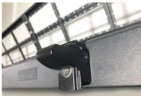
Cierre de seguridad