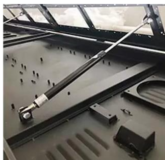
Muelle por gas