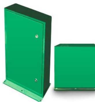
Tipos de anclaje

Ponemos a tu disposición varios tipos de anclajes para estos rótulos luminosos y adaptarnos a tu proyecto. Elige si necesitas un anclaje largo para ganar notoriedad o un anclaje slim, diseñado para cruces de tamaño medio.