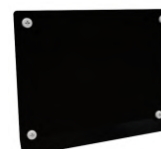
Tapa de conexiones